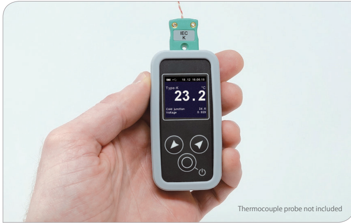
Thermocouple probe not included